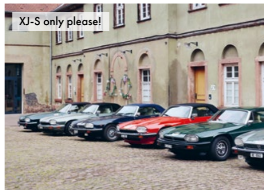
XJ-S only please!