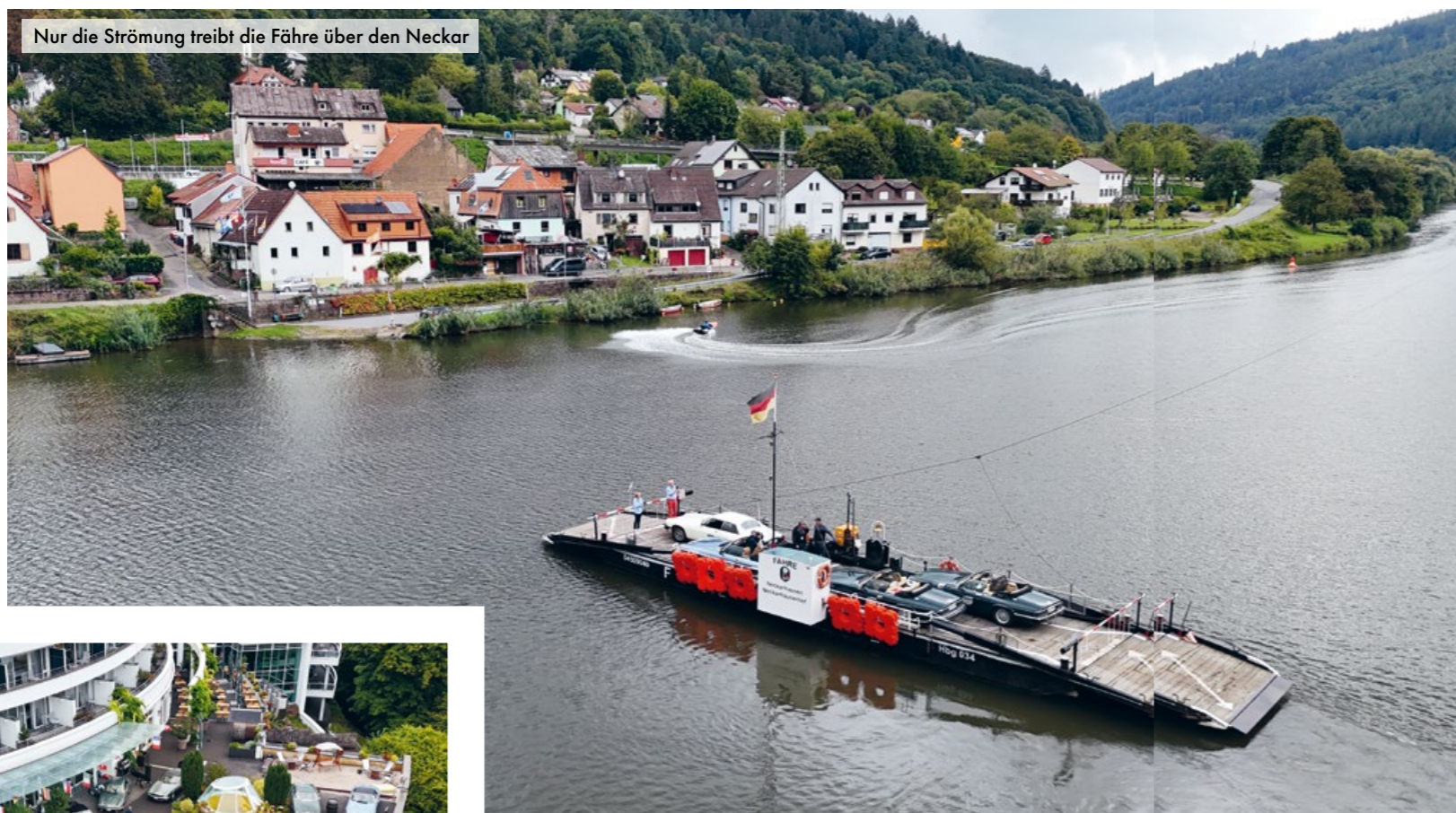
Nur die Strömung treibt die Fähre über den Neckar

Text: Rainer Landert