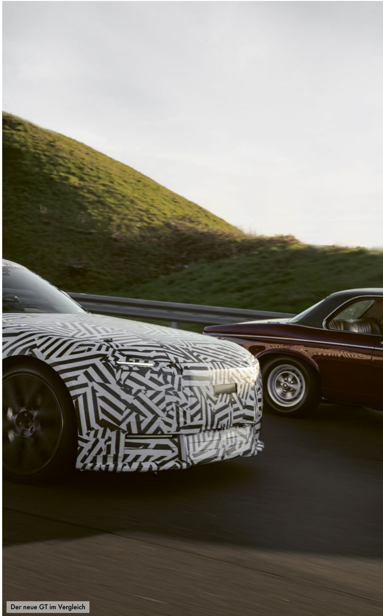
Der neue GT im Vergleich